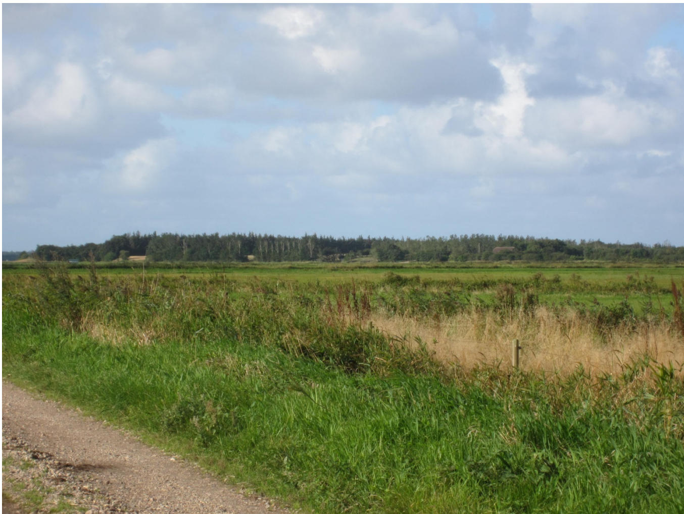
Figur 2: Janderup Holm set fra øst mod sydvest. Billedet er taget fra Åkirkebyvej mod den ansøgte lokalitet. Det er muligt at se taget af den eksisterende bygning og tilhørende "flagstang". "Flagstangen" er en målepind, der angiver en cirka størrelse på det ansøgte byggeri.

Den ansøgte lokalitet er en af de højest beliggende lokaliteter i forhold til det omkringliggende landskab. Samtidig er der passager uden høj bevoksning på dalsider ved den ansøgte lokalitet. I samspil med landskabets åbne karakter medfører det ansøgte byggeris placering, højde og materialer, at byggeriet vil blive yderst synligt fra ådalen øst og nordøst for den ansøgte lokalitet mod Janderup og fra Janderup Kirke. Ligeledes vil det ansøgte byggeri medføre lyspåvirkning af det omkring landskab og kirkeomgivelser som følge af det ansøgte byggeris placering og højde. Dernæst vurderes det ikke at være muligt for afskærmende beplantning af skærme de landskabelige og kulturhistoriske værdier fra påvirkningerne af det ansøgte byggeri. Det skyldes en kombination af den forventede højde af beplantning på egnen og det ansøgte byggeris placering og højde.