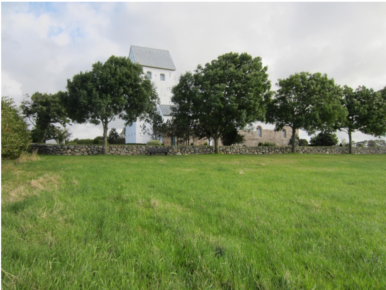
Figur 6: Janderup Kirke set fra græsplanen lige syd for stendiget, hvor billede 5 er taget.

Et byggeri, der er tilpasset de kulturhistoriske og landskabelige værdier på den ansøgte lokalitet vil ikke sløre den klare grænse mellem engene og bebyggelsen på holmen eller mellem engene og bebyggelsen på højderyggene mod nord og syd. Dernæst vil et tilpasset byggeri ikke visuelt opdele store frie udsyn eller sammenhængende engstrøg, da terrænforhold i samspil med beplantning på Janderup Holm på nuværende tidspunkt opdeler ådalen. Men et tilpasset byggeri må ikke kunne ses tydeligt fra ådalen øst og nordøst for lokaliteten og må ikke kunne ses tydeligt fra Janderup Kirke.