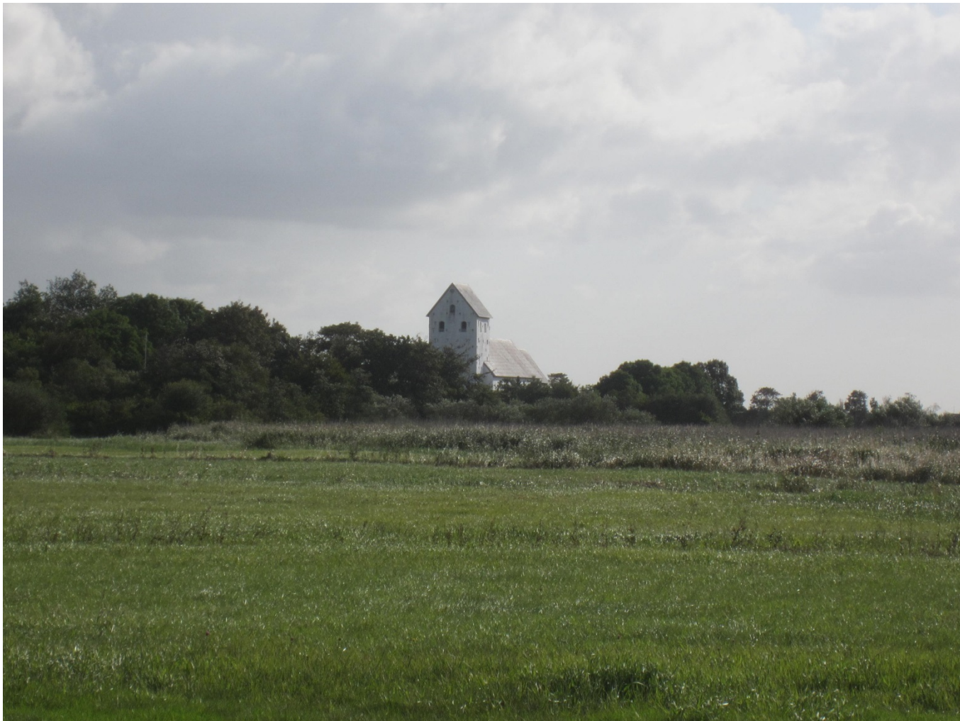
Figur 4: Janderup Kirke set fra Åkirkebyvej ved samme lokalitet som billede 3.