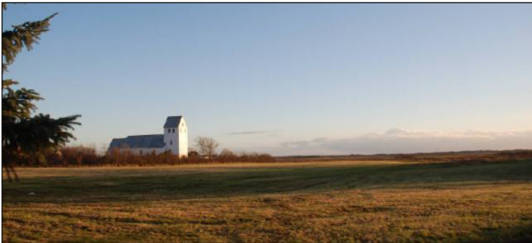
Udsigt over Janderup Kirke og Varde Ådal mod syd.

Hele landskabskarakterområdet bør beskyttes og bevares i den nuværende tilstand.