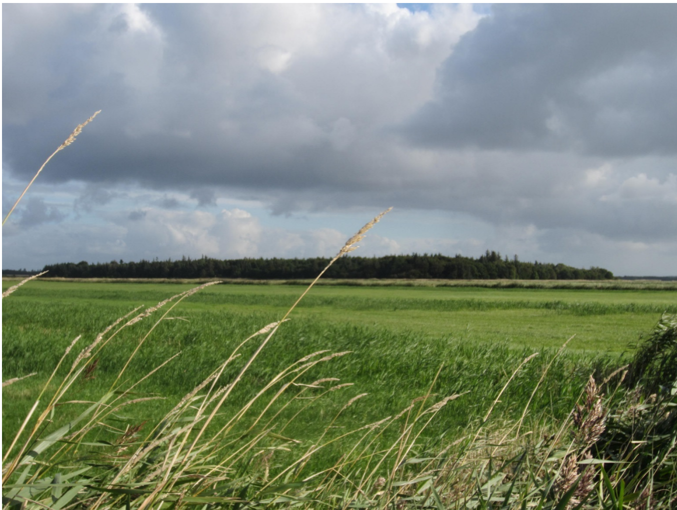
Figur 1: Janderup Holm set vest mod øst. Billedet er taget fra Åkirkevej et stykke fra Tarphagevej mod Janderup.