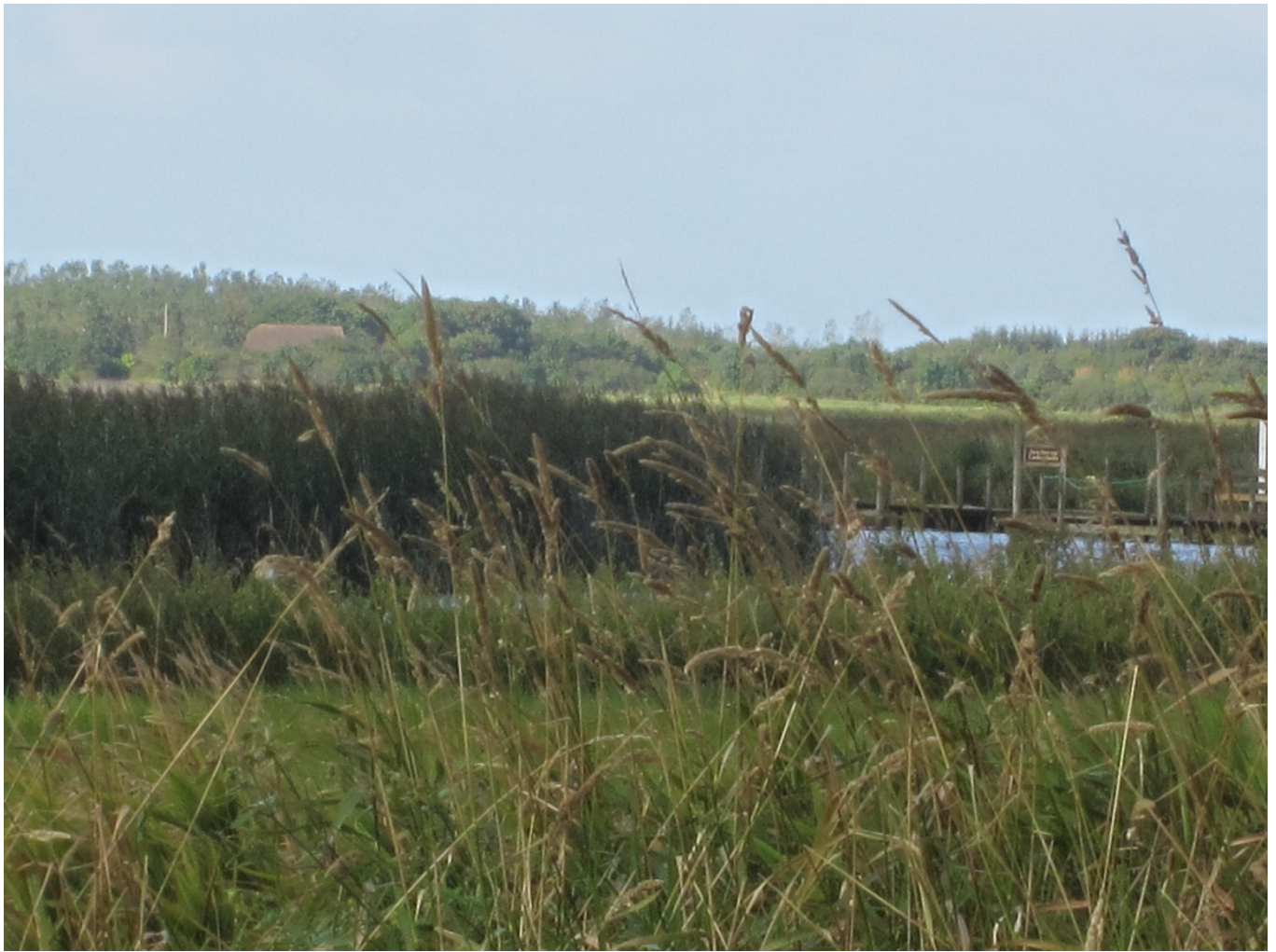
Figur 5: Den ansøgte lokalitet set fra græsplanen lige uden for stendiget ved Janderup Kirke.