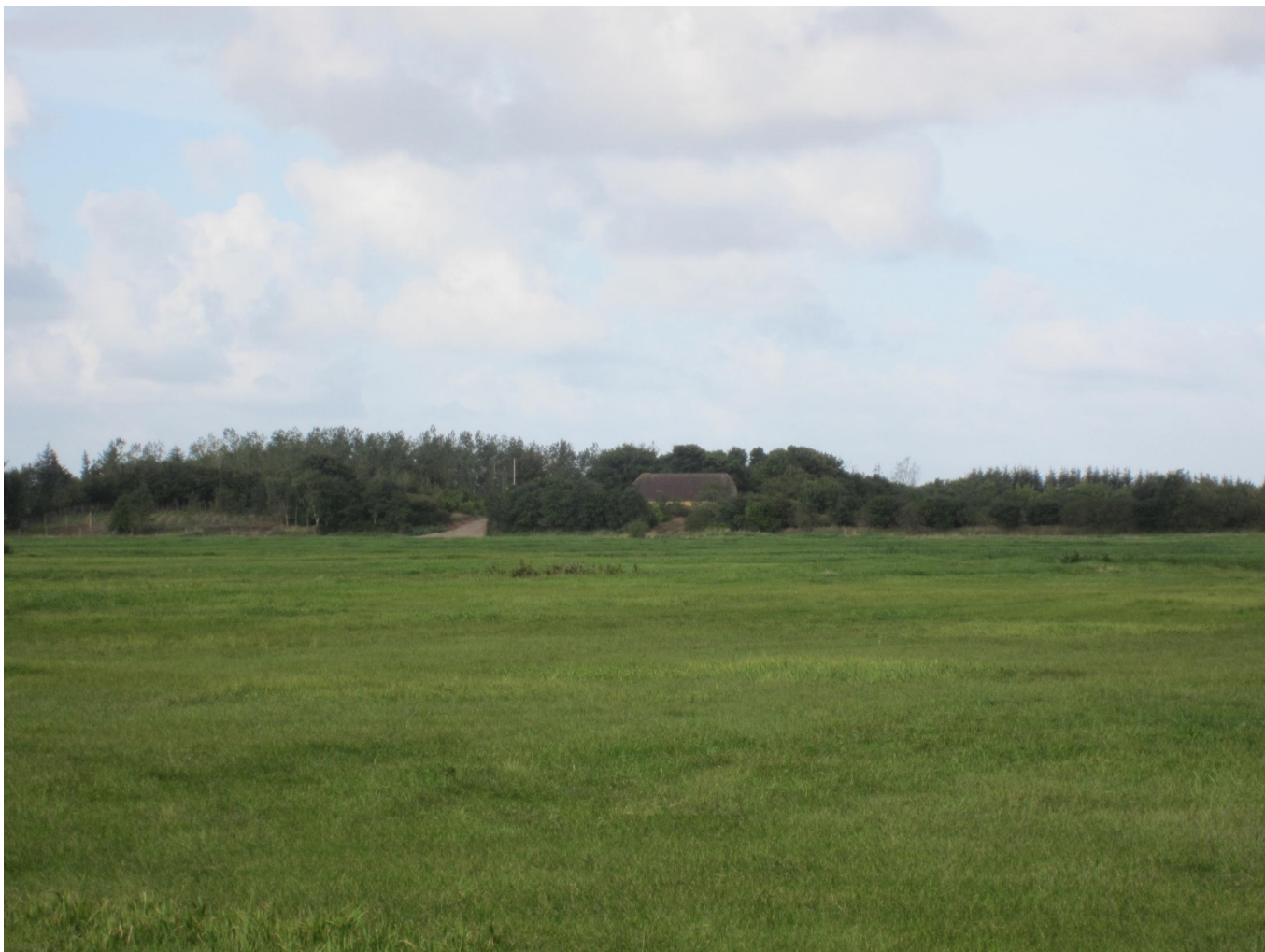
Figur 3: Den ansøgte lokalitet set fra Åkirkebyvej mod vest. Her fremgår det, af det eksisterende byggeri er synligt fra ådalen, og at lokaliteten ikke er omkranset af høj bevoksning, hvilket er modsat hovedparten af Janderup Holm.

Landskabets karakter på den ansøgte lokalitet har meget tæt sammenhæng med de kulturhistoriske værdier i området, da det samlede dallandskab som helhed er et unikt kulturhistorisk landskab. Derfor vurderes det ansøgte byggeri ikke at være tilpasset landskabets karakter, da det ansøgte byggeri vil være iøjnefaldende og højt i umiddelbar nærhed af græsningsengene samt skille sig ud fra de eksisterende gårde og huse i området. Dernæst vil det ansøgte byggeri hindre det frie udsyn fra Janderup Kirke ud over Varde Ådal, da byggeriet tydeligt vil kunne ses fra Janderup Kirkes græsplæne/græsmark syd for kirken.